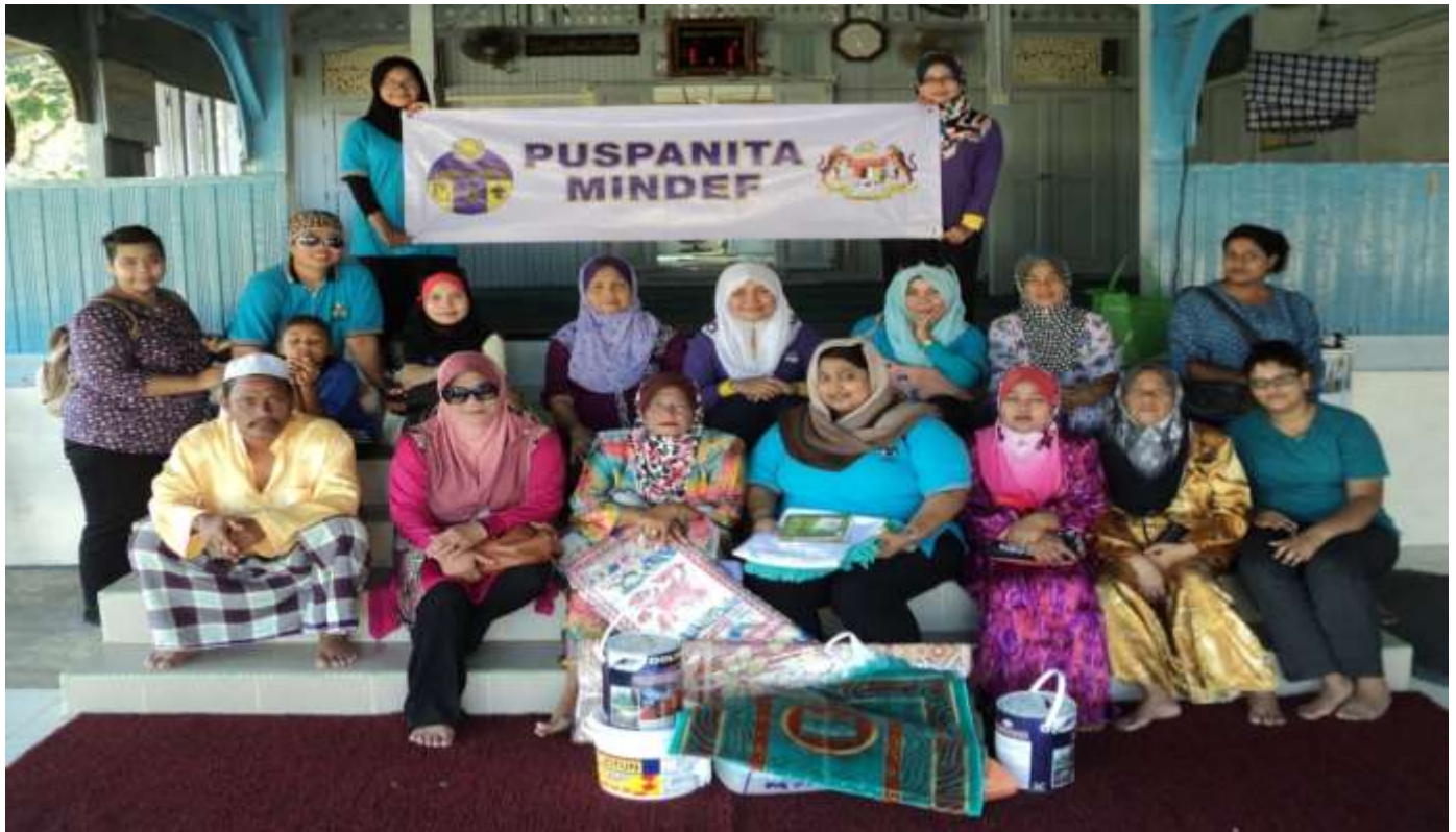
Bergambar kenangan bersama Ketua Kampung dan Ketua Wanita selepas aktiviti gotong-royong.