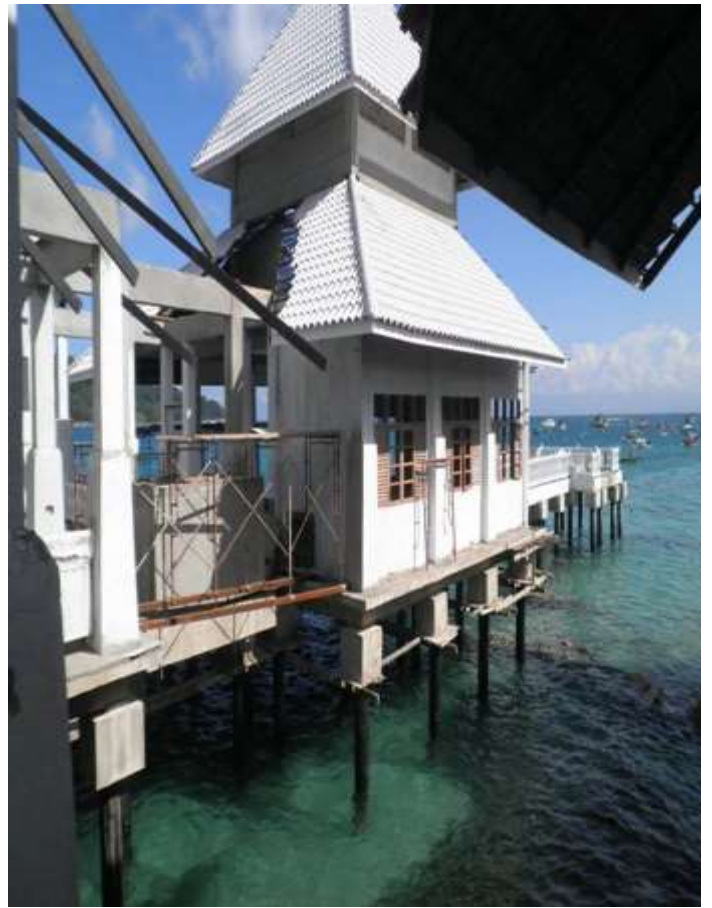
Pembinaan masjid baru di Kampung Pulau Perhentian Kecil.