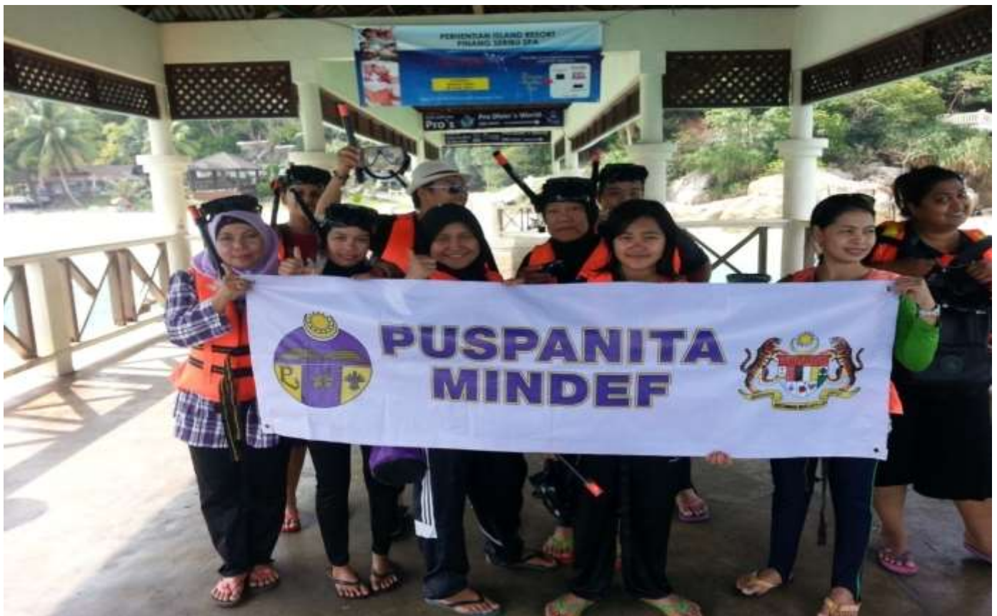
JKK Pembangunan Alam Bina Lestari dan ahli Puspanita bergambar kenangan bersama mengesatkan siraturrahim. Bersedia untuk Snorkeling.