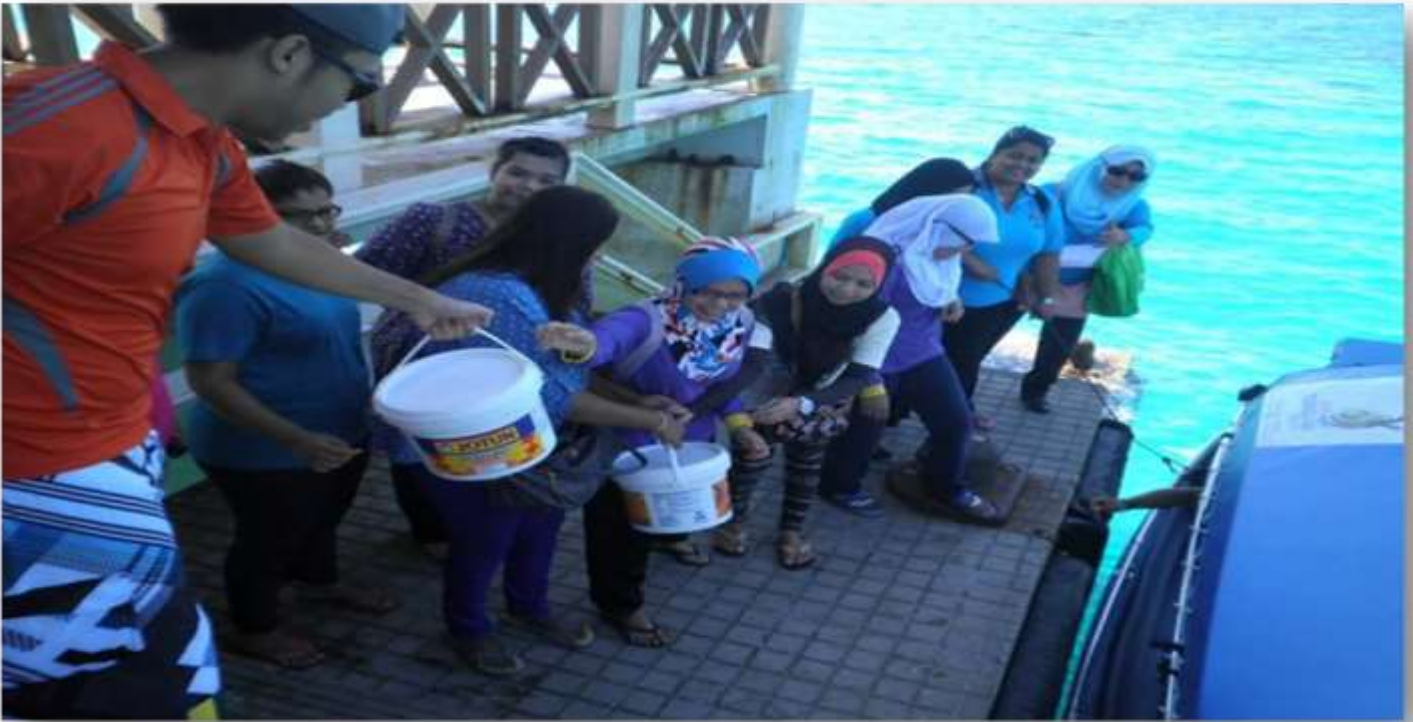
Yang Ringan Sama Dijinjing Yang Berat Sama Dipikul