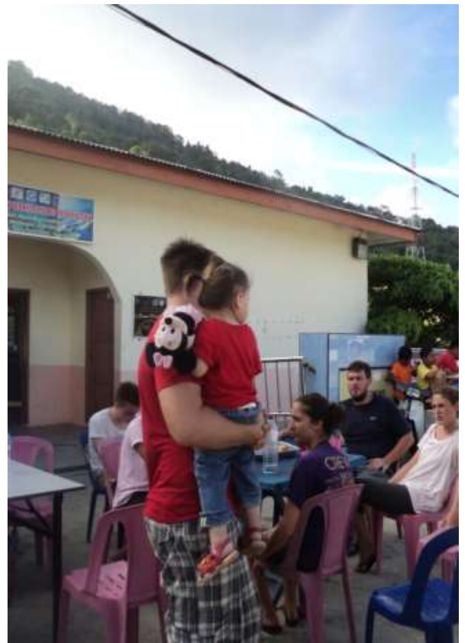
Aktiviti Persatuan Wanita Pulau Perhentian dan minum petang bersama penduduk dan tetamu Kampung Pulau Perhentian.