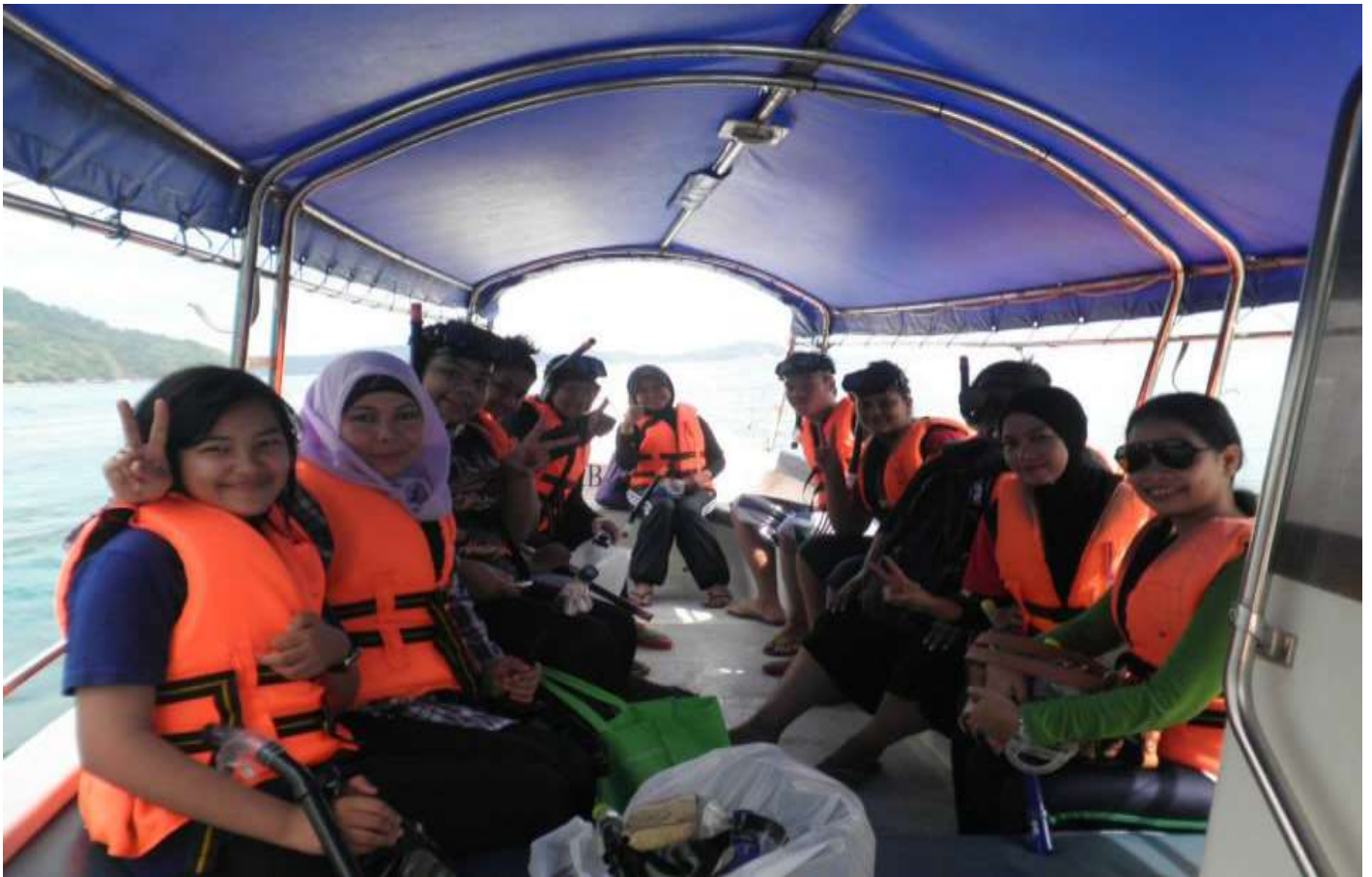
Ahli Puspanita bersiap sedia di atas bot aktiviti snorkeling.