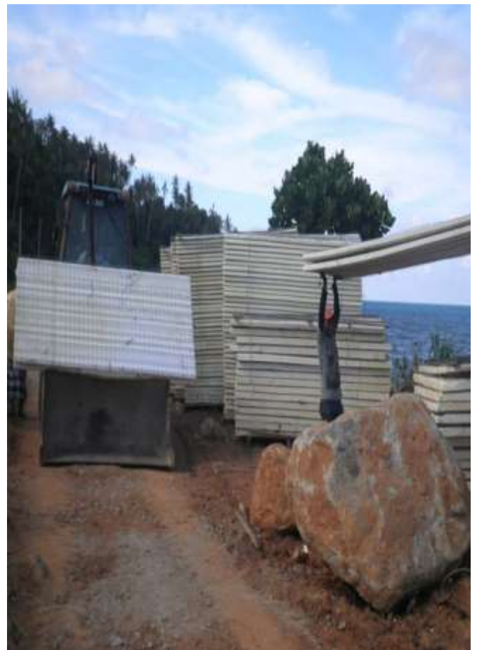
Pembangunan Infrastruktur di Kampung Pulau Perhentian Kecil.