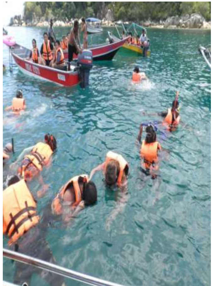
Aktiviti snorkeling di pantai Pulau Perhentian.