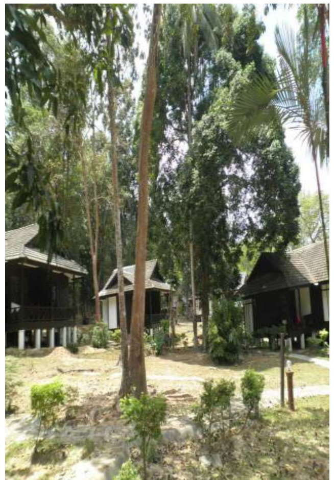
Keindahan pantai dan kehijauan alam di Pulau Perhentian.