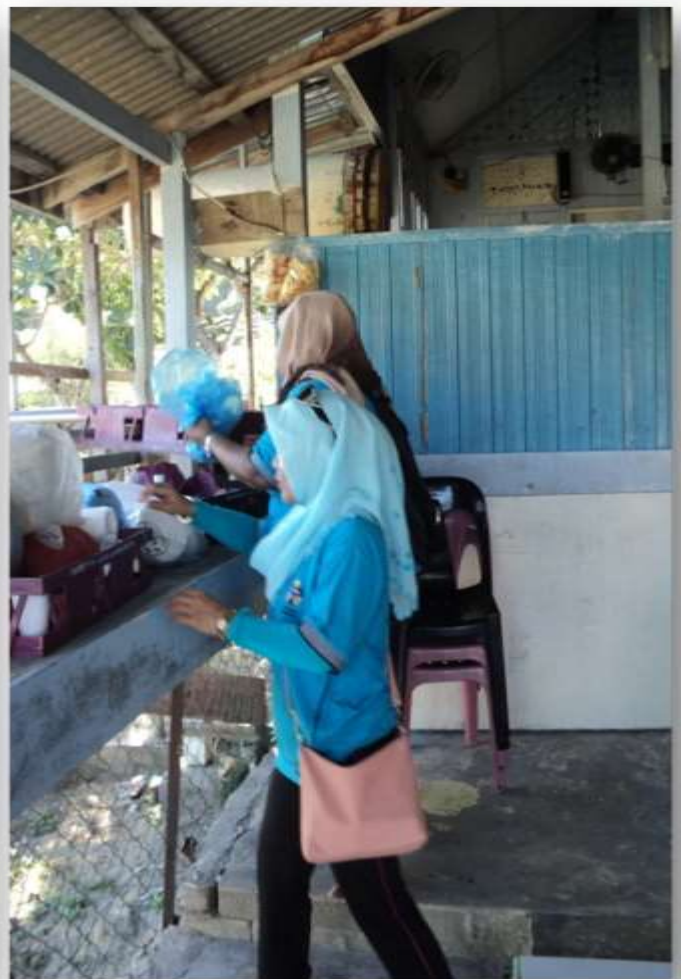
Aktiviti gotong-royong di pantai dan Surau Kampung Pulau Perhentian Kecil