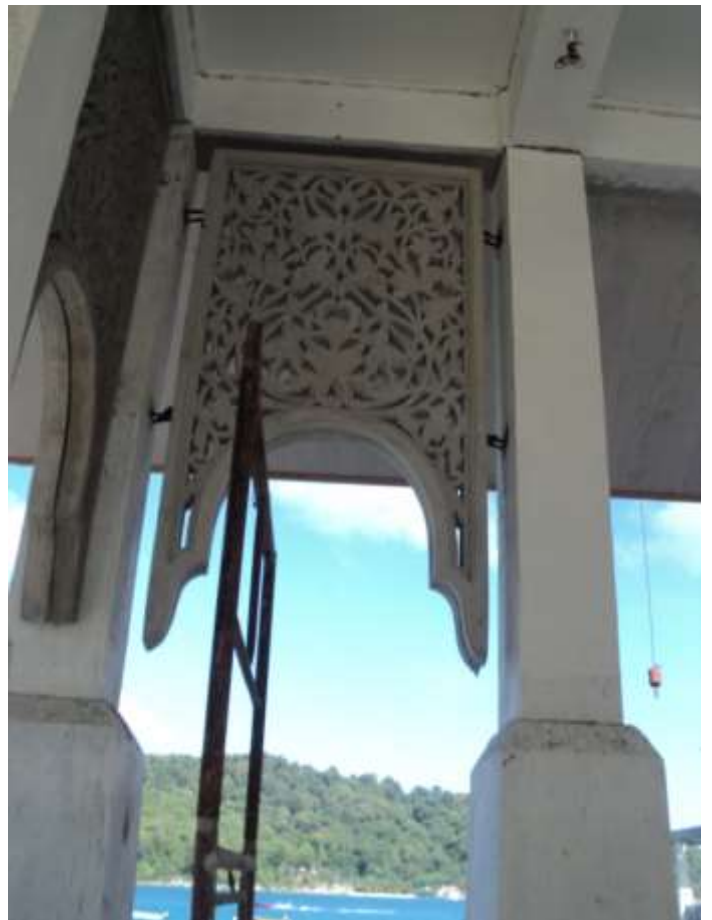
Salah satu kemahiran penduduk di Kg Pulau Perhentian Kecil membuat KKV Kerawang Bunga Cempaka bagi binaan masjid bar